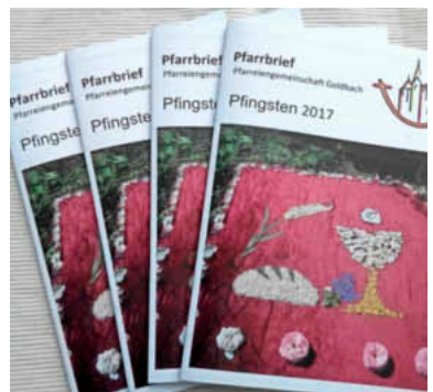
So sieht er aus, der neue Pfarrbrief der Pfarreiengemeinschaft.

Darüber hinaus finden sich auf Seite 5 noch weitere Beweise dieser schönen Tradition. Außerdem wie immer Berichte von Veranstaltungen der letzten Monate und von den verschiedenen Gruppen und Einrichtungen der Pfarreiengemeinschaft. Sie zeigen, wie lebendig das kirchliche Leben in Goldbach und Unterafferbach ist. Eine kleine aber feine Neuerung: