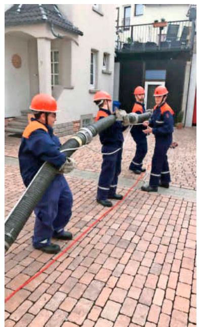
Teamwork: Wenigumstädter Feuerwehranwärter bei der Montage einer Saugleitung.